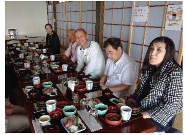
レストラン舟屋(昼食)