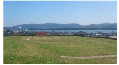
郷土資料館から観る橋立