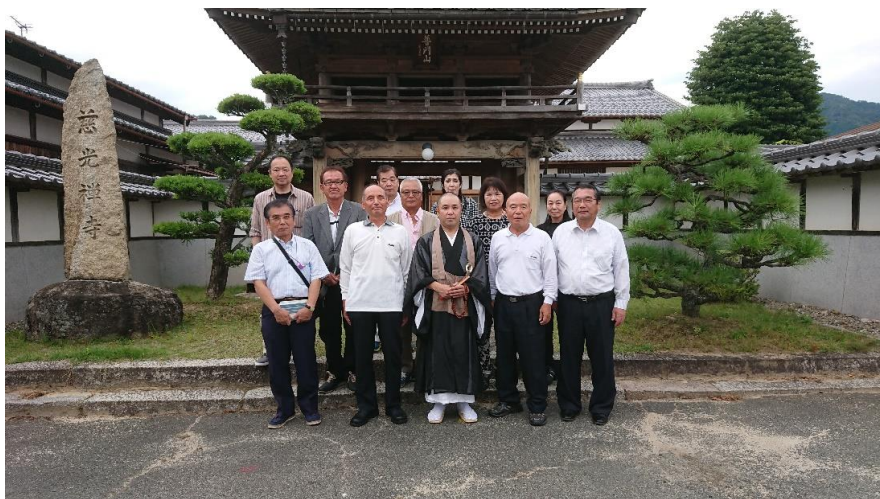
菩提寺 晋門山 慈光寺（開基は一色満範）