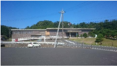
京都府立丹後郷土資料館