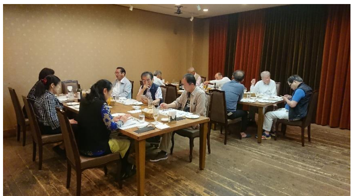
フレンチで宴会(夕食)