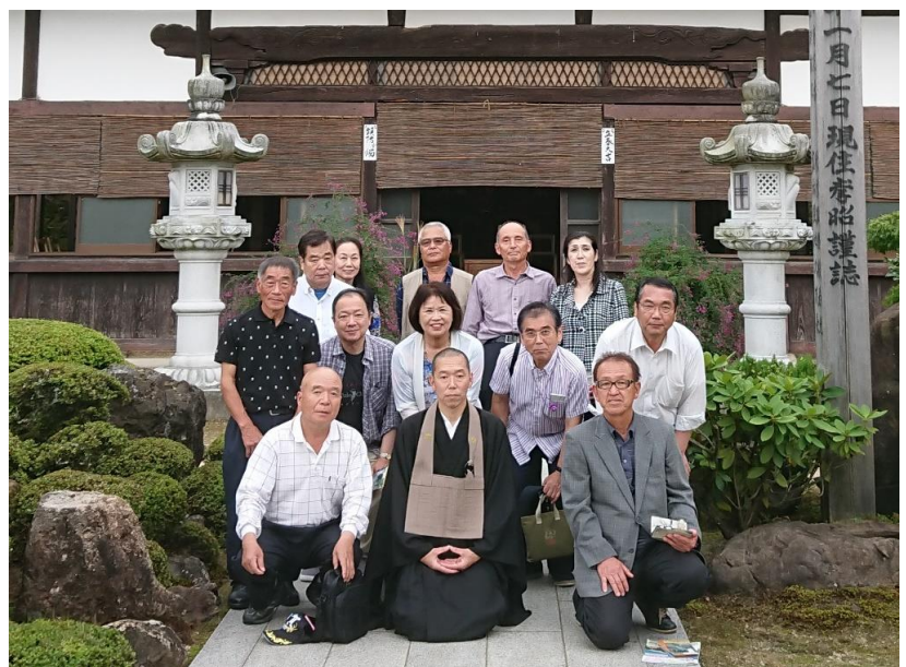
菩提寺 大圓山 盛林寺